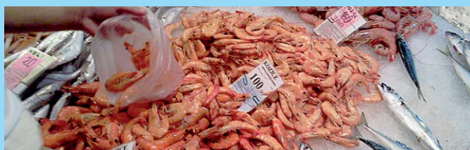
Z nabídky rybiho trhu v Pule

Přidáme slávky, osolíme, opepříme a podlijeme bílým vínem. Dusíme zvolna pod poklicí cca 10 minut a nemícháme. Hotové slávky pokapeme citronovou šťávou a posypeme nasekanou petrželkou. Když je hotovo, dobře hrnec utěsníme pokličkou a pořádně s ním zatřese, aby se do mušlí dostala všechna omáčka. Servírujeme v hlubokém talíři a případné neotevřené mušle nekompromisně vyhodíme. Slávky jíme rukama. Když sníme první slávku, lasturu použijeme jako „pinzetku“ a vytahujeme s ní lahodné maso ze zbývajících slávek. Do šťávy namáčíme bagetku a zapijeme bílým vínem.