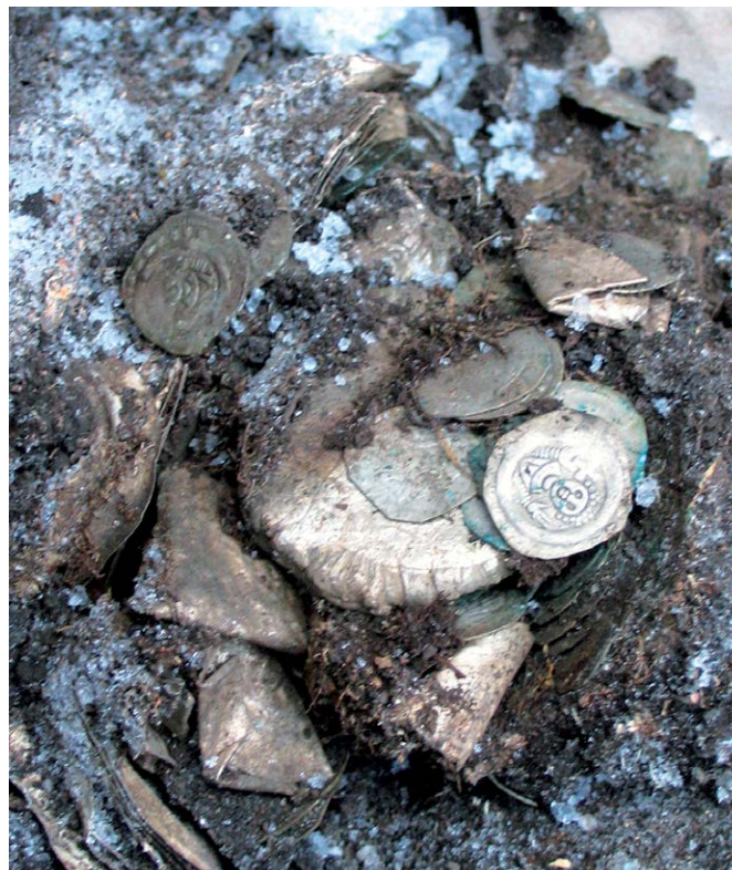
Zmrzlá země vydala poklad ze 13. století.

Je evidentní, že současná situace je neudržitelná. Platné zákony, kterými se řídí ochrana archeologických památek, vznikly před desítkami let a jsou pouze novelizovány. Není nutné