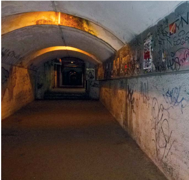
Prostory nádraží Praha-Vysočany na začátku tohoto roku

V březnovém Pražském kurýru nás zastupitel Jiří Vávra (TOP 09) upozornil na ostudu v podobě nevzhledných prostorů na nádraží Praha-Vysočany. A to, co léta zřejmě nešlo, se najednou rychle podařilo: přístup na nástupiště vypadá výrazně lépe a cestování vlakem je tak zase o něco příjemnější.