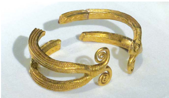
Nález zlatého šperku z doby bronzové ze sbírek Národního muzea

z míst, které byly už od starověku obydleny vyspělou řeckou a římskou civilizací. Dnes jsou prokopány doslova až na skálu a zahajovat tam archeologický výzkum nemá vůbec smysl. Touto cestou by se naše archeologie neměla vydat.