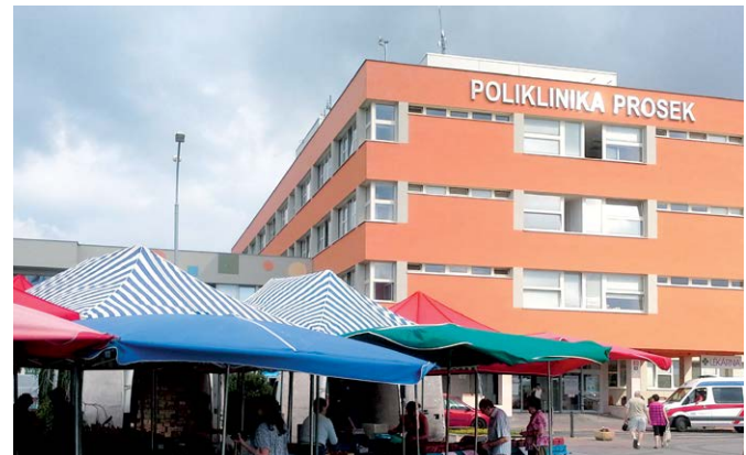
Poliklinika Prosek – vyšší komfort a úspora nákladů