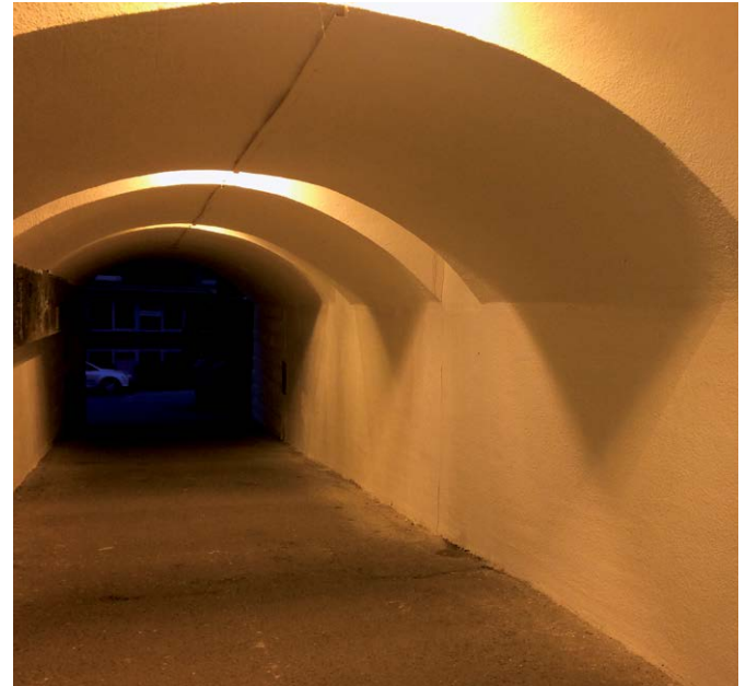
Současný stav po opravě