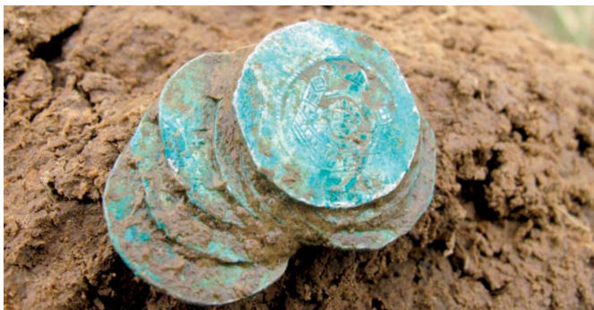
Část pokladu českých denárů z 12. století