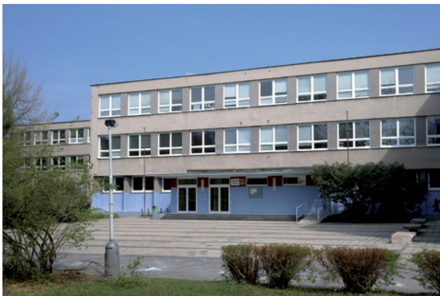
Také ZŠ Novoborská prošla rekonstrukcí.