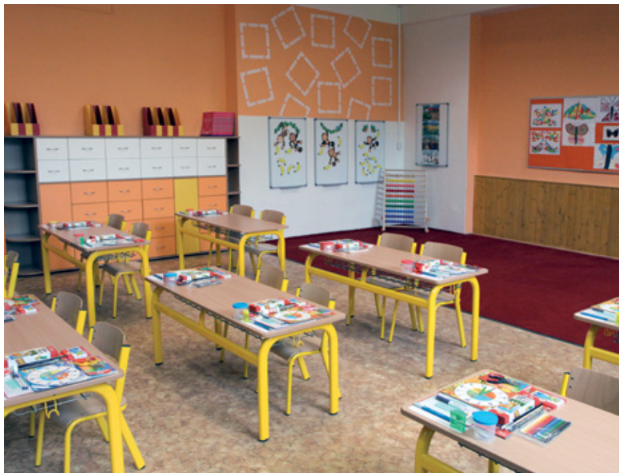
ZŠ Novoborská, přípravná třída

v rámci celé České republiky. Teď se musíme soustředit na základní školy. Naše ředitelky proto přijímají jen děti s trvalým pobytem v Městské části Praha 9,“ řekla radní s tím, že toto opatření je zavedeno už druhým rokem.