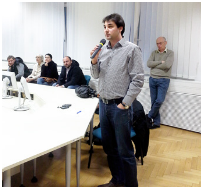
Debata před hlasováním byla rozsáhlá a většinou i klidná.