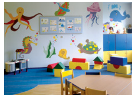
Družina přípravné třídy ZŠ Na Balabence